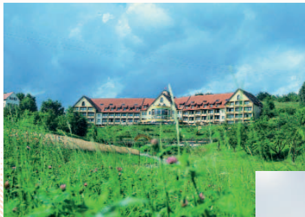
BIO-THERMEN-HOTEL Bad Waltersdorf, Steiermark

Vorstellung unseres neuen Hotellabels „Fasten für Genießer“ „Schöner kann Fasten nicht sein!“